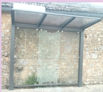
La vitre de l'abri bus cassée par un impact de balle ou un caillou...