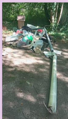
Un dépôt sauvage dans le chemin d'un bois...