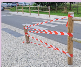
Un ou une automobiliste qui a oublié de laisser son adresse.