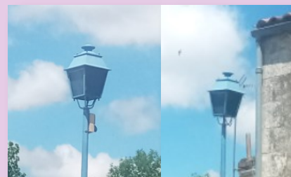
Deux candélabres peints en noir au passage surélevé du côté de Pont l'Abbé !!!

Les candélabres des deux passages surélevés restent allumés toute la nuit pour une question de sécurité.