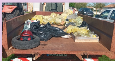
Et je n'oublie pas tout ce que l'on ramasse lors du nettoyage de la nature avec les chasseurs. Cette multitude de canettes, de bouteilles et autres emballages de sandwiches balancés par la fenêtre.

On peut aussi ajouter ceux qui viennent aux bornes à verre ou à vêtements et qui laissent leurs bouteilles ou textiles au pied sans prendre la peine de les mettre dedans.